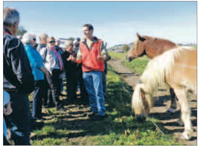
Zwei Fernsehdrehorte, im Bild Gut Aiderbichl in Henndorf...