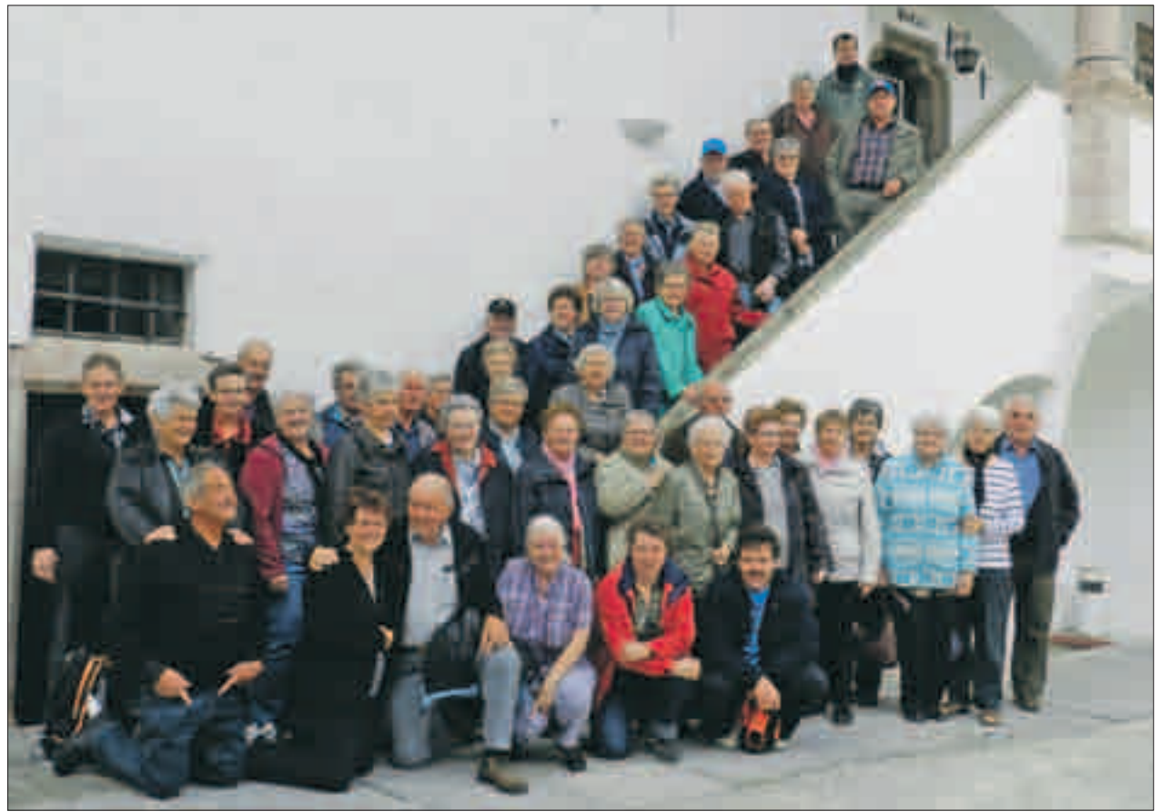
Gut gelaunt waren die Leserreiseteilnehmerinnen und -teilnehmer im malerischen Salzkammergut unterwegs.

Grosse Augen gab es bei den Reiseteilnehmerinnen und -teilnehmern, als am Morgen der Abreise in Faistenau frischer Schnee lag. Wie mit Puderzucker bestreut, präsentierten sich die Berge im Salzkammergut. Doch mit