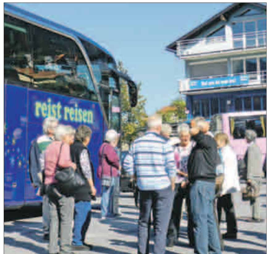
Strahlendes Herbstwetter begleitete die Gruppe praktisch während der ganzen Reise.