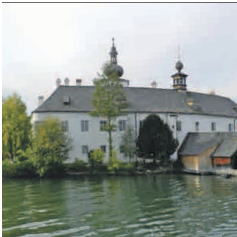
... und das «Schlosshotel Ort» am Traunsee waren Höhepunkte der Leserreise.